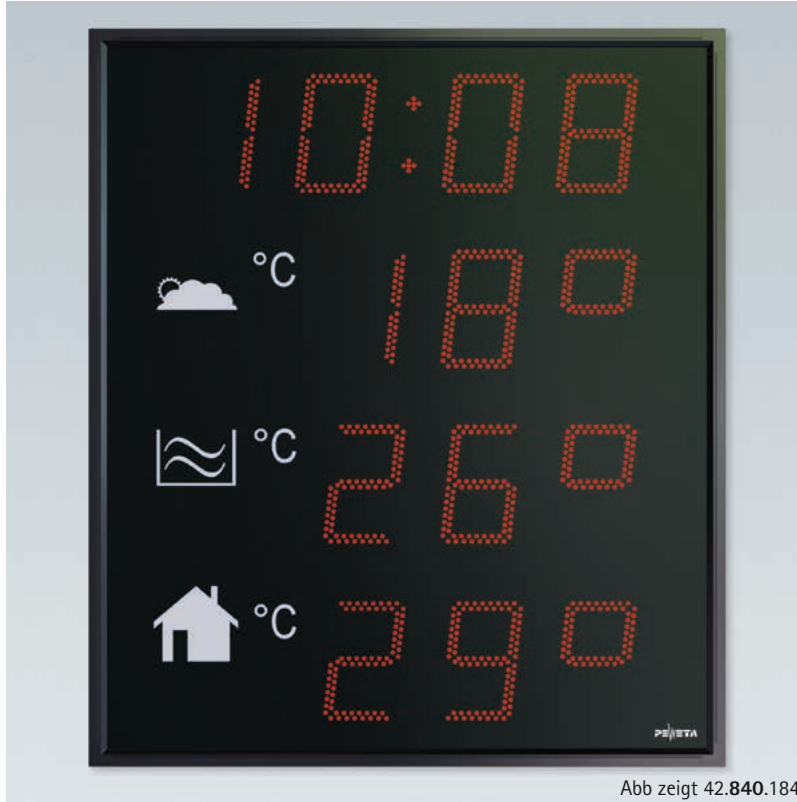
Abb zeigt 42.840.184