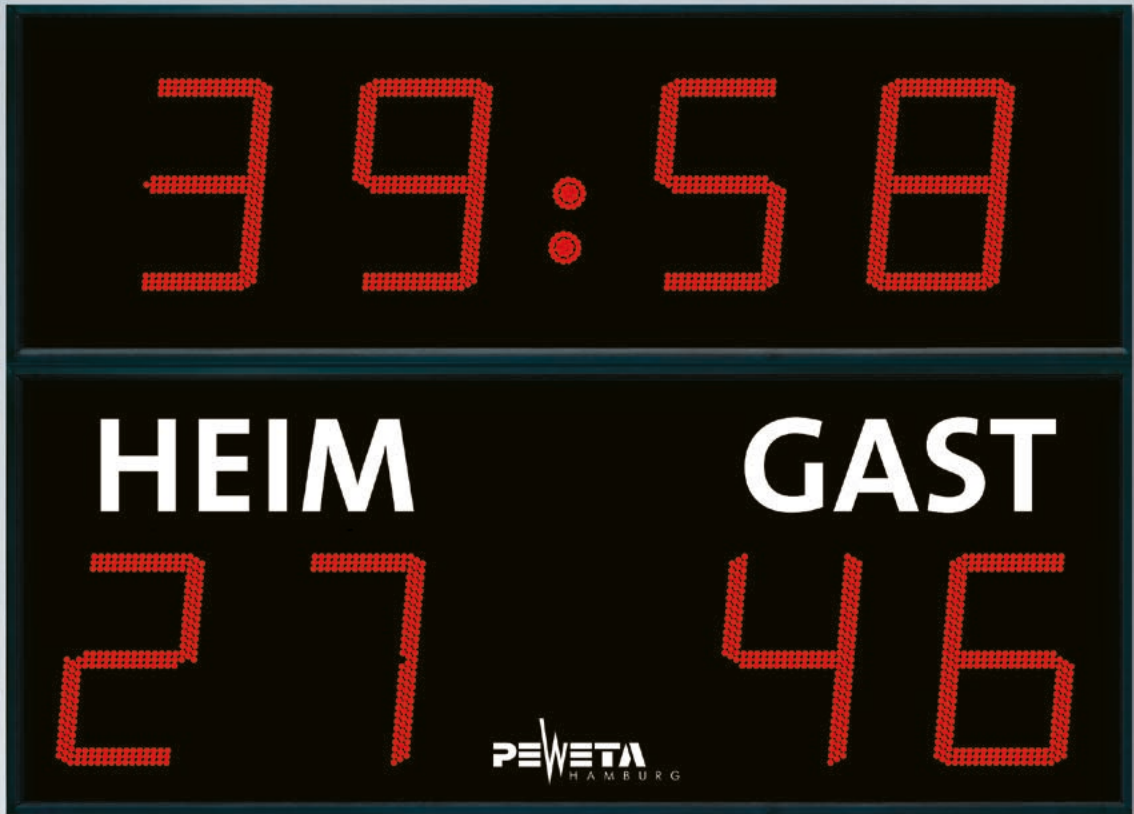
Abb. zeigt 24.830.422

Spielergebnis-Anzeigetafel in LED-Anzeigetechnik, 7-Segment- Anzeigen, Ziffernhöhe 460 mm, Lesbarkeit bis ca. 180 m. Geeignet für Fußball, Rugby und Feldhockey.