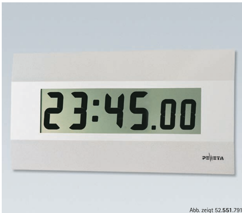
Abb. zeigt 52.551.791

1-zeilige 9-Segment-LCD-Anzeige, 6-stellig, extra große Anzeige von Stunde und Minute (Ziffernhöhe 75 mm) sowie Sekunde (Ziffernhöhe 60 mm). Temperaturanzeige (Option) im Wechsel mit der Uhrzeit möglich.