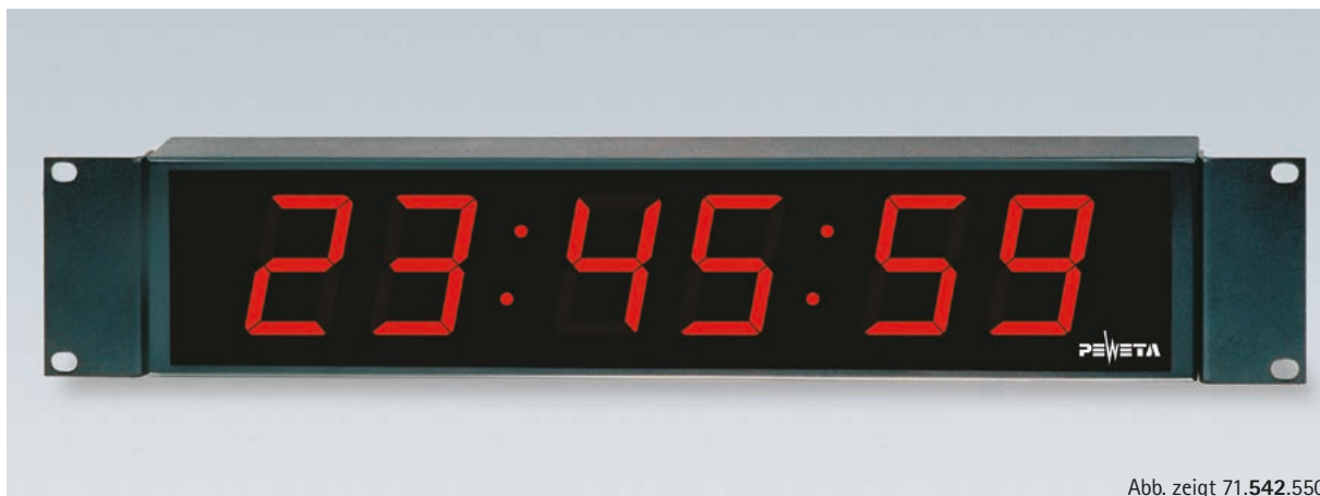
Abb. zeigt 71.542.550