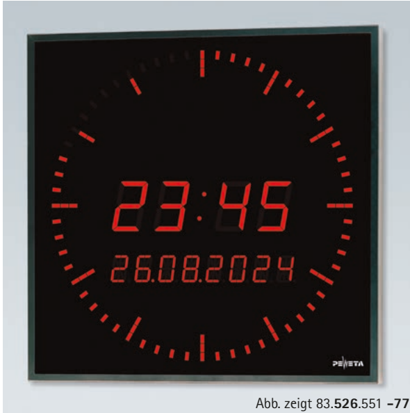
Abb. zeigt 83.526.551 -77