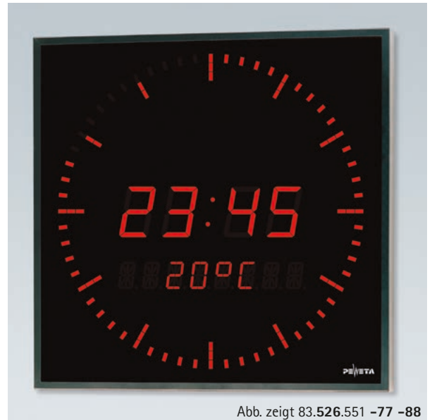
Abb. zeigt 83.526.551 -77 -88

Diese Wanduhr, ca. 400x400 mm, zeigt in der Standardausführung die Uhrzeit in Stunden und Minuten und, anhand eines umlaufenden Sekundenkranzes, die Sekunden, aufwärts zählend. Mit einer zusätzlichen 8-stelligen alphanumerischen Anzeige wird diese Uhr zu einem umfangreichen »Informations-Center«. Je nach technischer Ausstattung liefert diese Uhr alle Informationen, die für den gewünschten Einsatzzweck gefordert werden – präzise, professionell und außerordentlich zuverlässig!