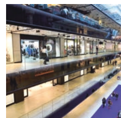
Innenuhren digital einseitig