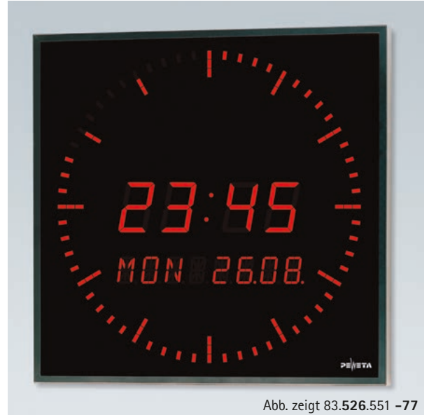
Abb. zeigt 83.526.551 -77