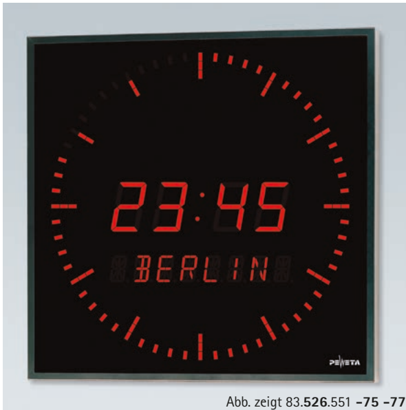
Abb. zeigt 83.526.551 -75 -77