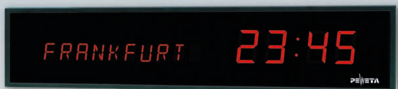
Abb. zeigt 91.512.551 -75

Unterschiedliche Datumsformate im Menü einstellbar