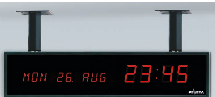
Abb. zeigt 91.512.553

Unterschiedliche Datumsformate im Menü einstellbar