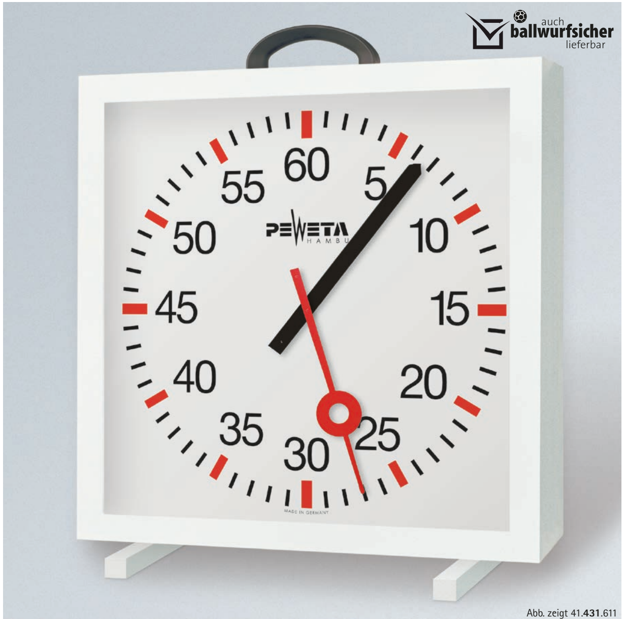
Abb. zeigt 41.431.611

Diese Trainingsuhr ermöglicht die Anzeige von Zwischenzeiten im Schwimmtraining und beim Einschwimmen. Die Zeiten nimmt jeder Schwimmer selbst. Die Uhr zeigt die abgelaufene Zeit in Minuten und Sekunden an.