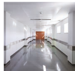
Innenuhren analog doppelseitig