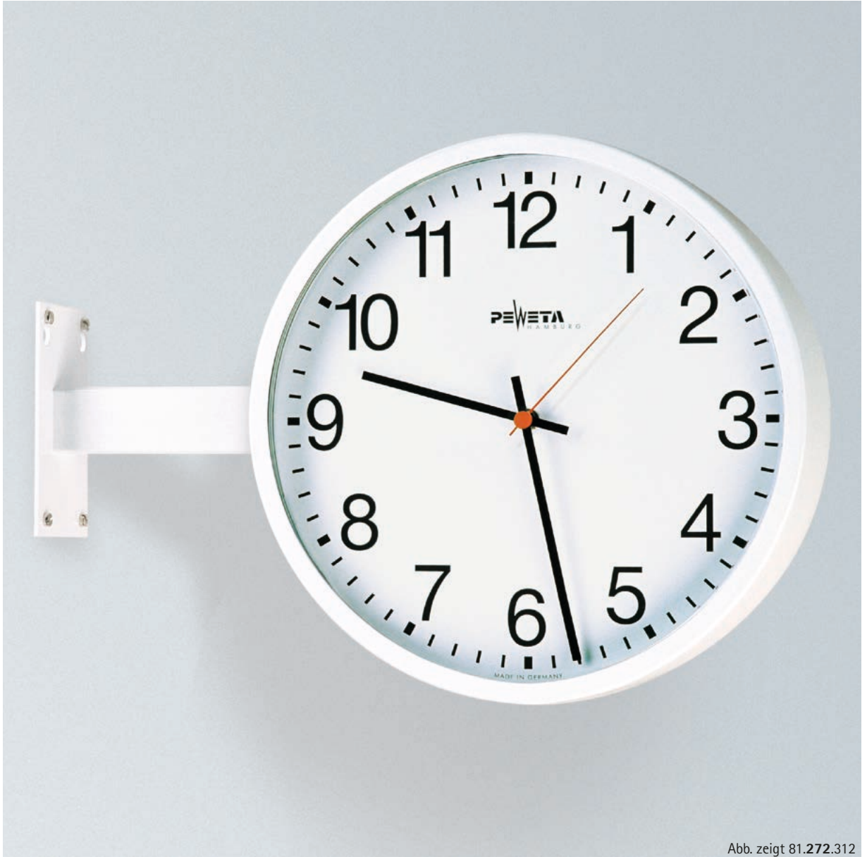
Abb. zeigt 81.272.312

Doppelseitige Uhren – überall dort, wo die Uhrzeit beidseitig ablesbar sein soll. Metall, robust, passt!