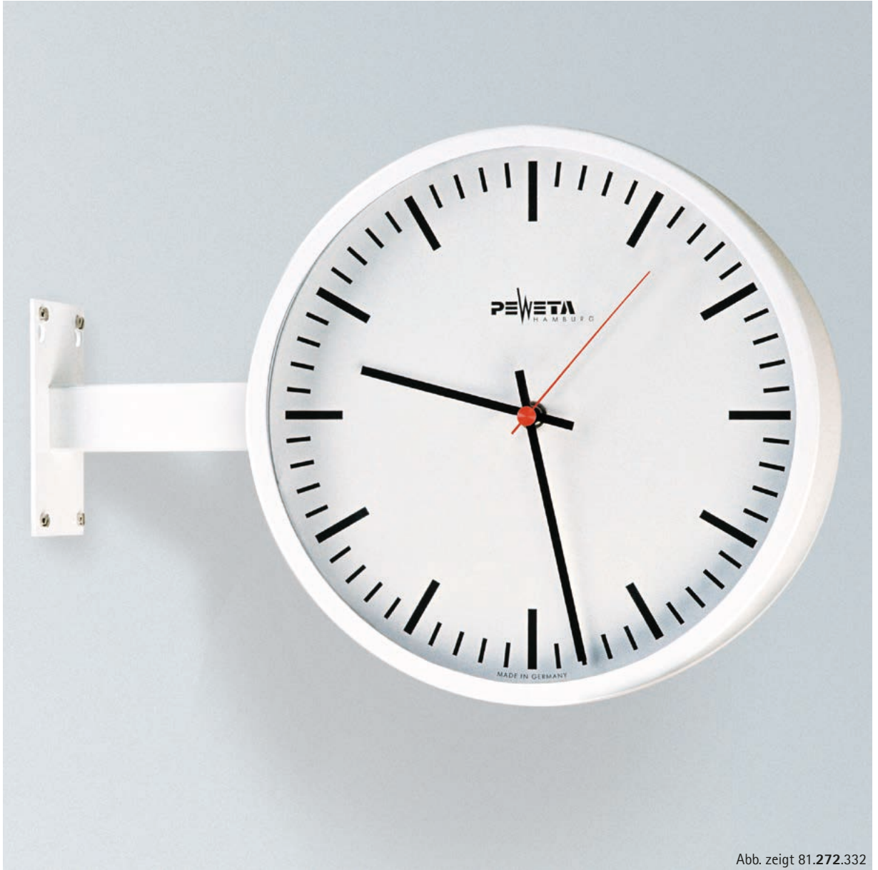
Abb. zeigt 81.272.332

Doppelseitige Uhren – überall dort, wo die Uhrzeit beidseitig ablesbar sein soll. Metall, robust, passt!