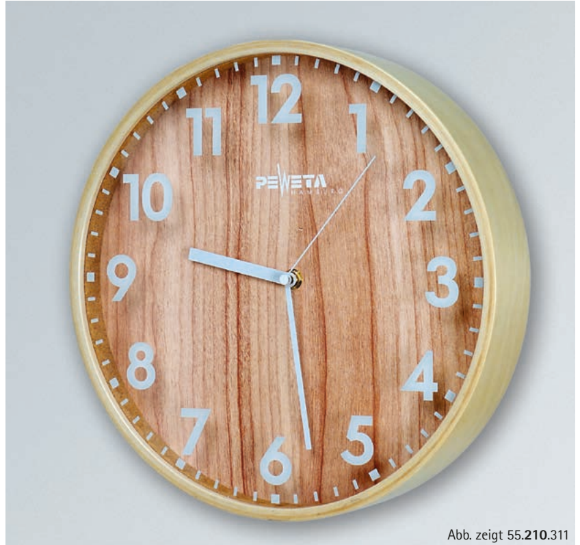
Abb. zeigt 55.210.311

FSC® steht für „Forest Stewardship Council®“. Es ist ein internationales Zertifizierungssystem für eine nachhaltige Waldwirtschaft. Das Holz mit FSC-Siegel kommt aus Wäldern, die verantwortungsvoll bewirtschaftet werden. Das in dieser Uhr verwendete Holz ist Chain-of-Custody (CoC) zertifiziert als FSC 100%, FSC Mix.