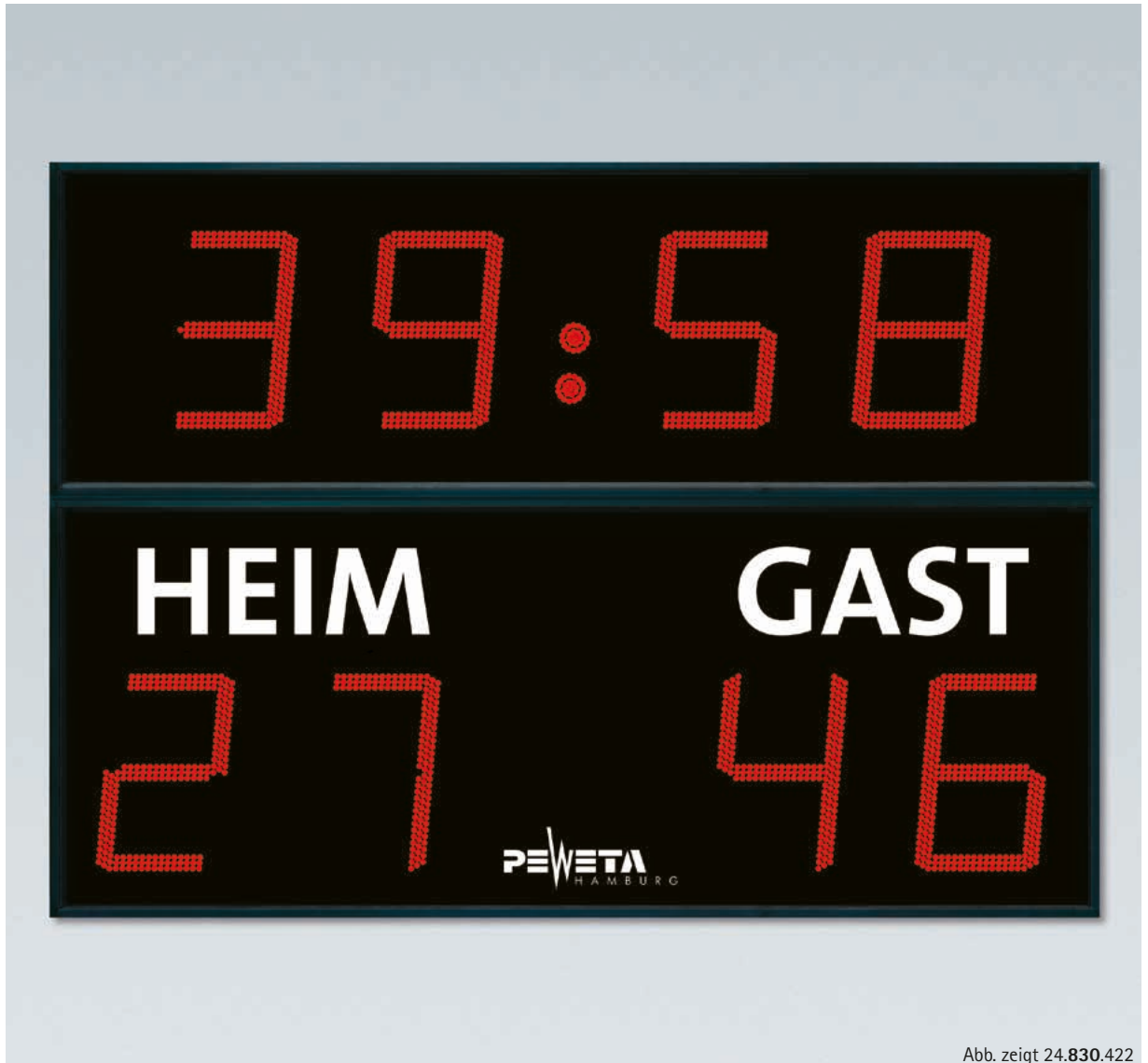
Abb. zeigt 24.830.422

Spielergebnis-Anzeigetafel in LED-Anzeigetechnik, 7-Segment- Anzeigen, Ziffernhöhe 460 mm, Lesbarkeit bis ca. 180 m. Geeignet für Fußball, Rugby und Feldhockey.