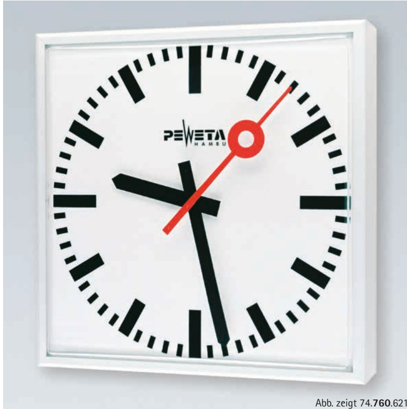
Abb. zeigt 74.760.621