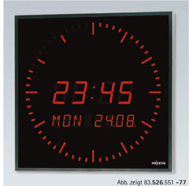
Abb. zeigt 83.526.551 -77