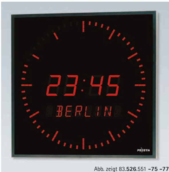
Abb. zeigt 83.526.551 -75 -77