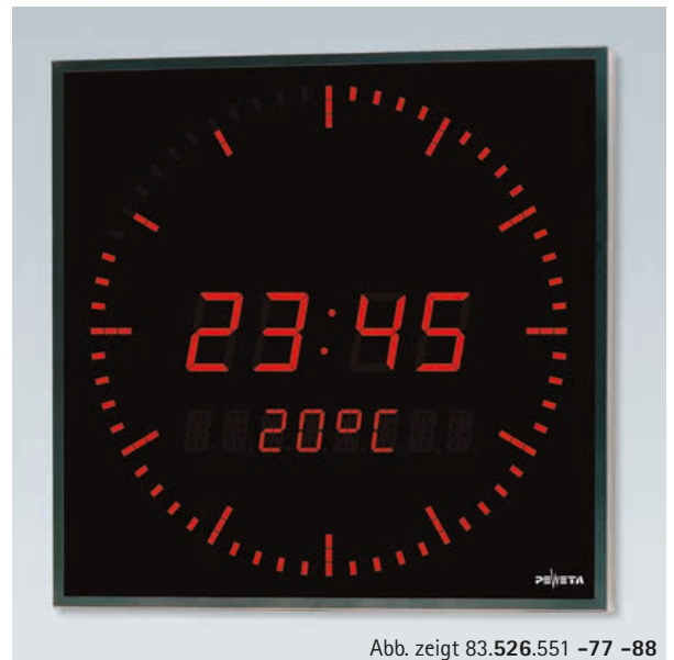
Abb. zeigt 83.526.551 -77 -88

Diese Wanduhr, ca. 400x400 mm, zeigt in der Standardausführung die Uhrzeit in Stunden und Minuten und, anhand eines umlaufenden Sekundenkranzes, die Sekunden, aufwärts zählend. Mit einer zusätzlichen 8-stelligen alphanumerischen Anzeige wird diese Uhr zu einem umfangreichen »Informations-Center«. Je nach technischer Ausstattung liefert diese Uhr alle Informationen, die für den gewünschten Einsatzzweck gefordert werden – präzise, professionell und außerordentlich zuverlässig!