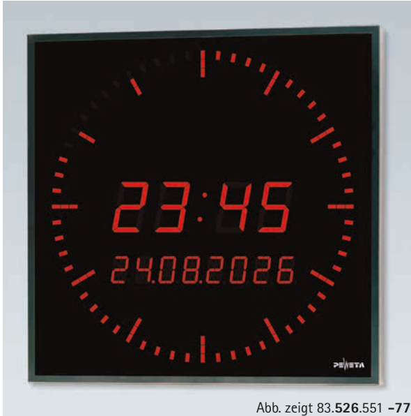
Abb. zeigt 83.526.551 -77